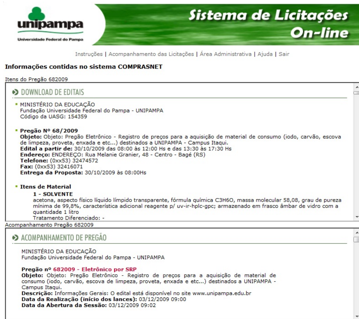
Figura 4 – Detalhes do processo no Comprasnet

A opção Comprasnet apresenta as informações sobre a licitação contidas no Portal de Compras do Governo Federal (figura 4).