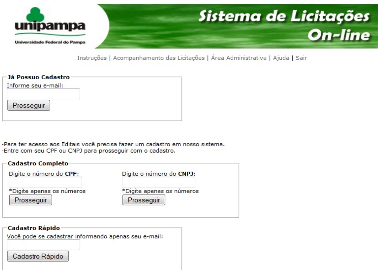
Figura 5 – Tela com as opções de Cadastro

É importante realizar o “ Cadastro completo ” para que a instituição possa manter contato com a empresa informando de futuras licitações e mantendo a mesma informada do processo licitatório, o cadastro rápido armazenará somente o e-mail da empresa.