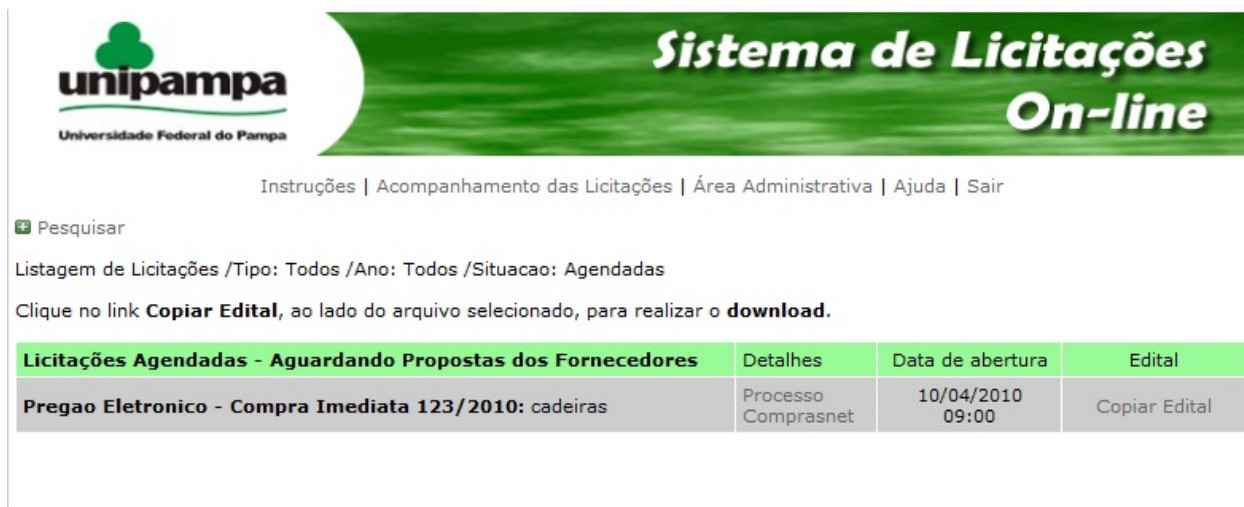
Figura 1 - Página de acompanhamento das licitações

Na página principal apresentará a tela de acompanhamento das licitações que estão agendadas (Figura 1).