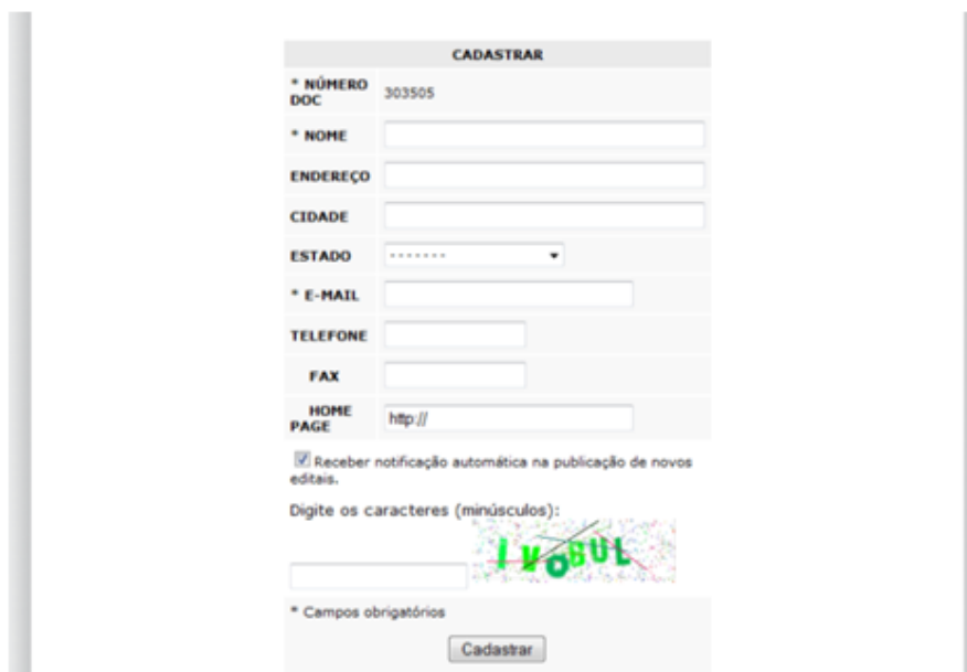
Figura 6 – Tela de Cadastro do Fornecedor